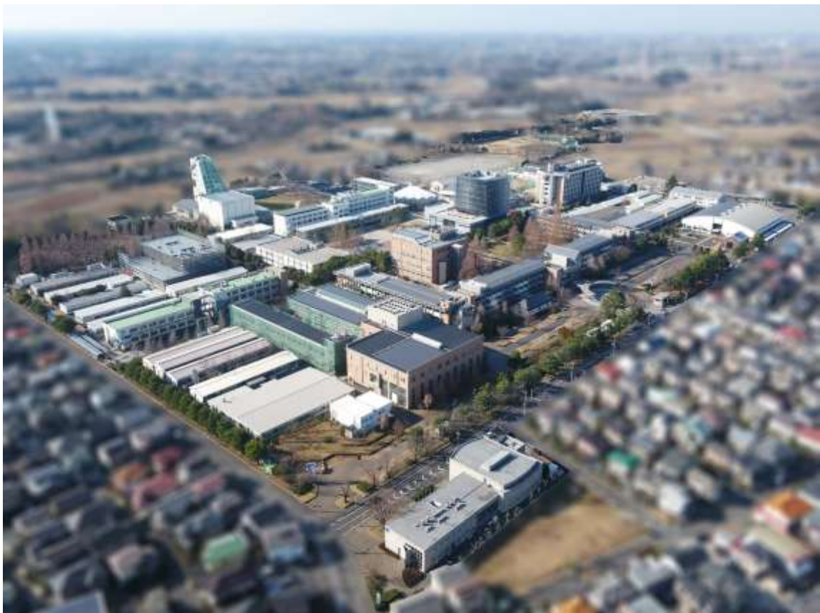
(日本工業大学：埼玉県)